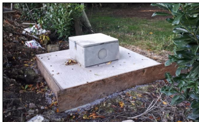
Exemples d'aménagement de têtes de forage dédiés à l'irrigation de cultures et aux besoins des cheptels